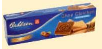
Bahlsen Ohne Gleichen mit feiner Haselnuss-Nugatcreme Bahlsen, 30001 Hannover

Info Die Inter Biscuits GmbH gehört zur Bahlsen KG. Mit dem Ort Schneverdingen ist der Branchenprimus seit Langem eng verbunden, denn seit der Übernahme der Keks- und Waffelfabrik Gottena besitzt Bahlsen hier einen Produktionsstandort, der vornehmlich auf No-Name-Gebäck ausgerichtet ist.