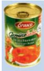
Erasco Strauchtomaten-Basilikum-Suppe Campbell's Germany, 23560 Lübeck

Info Lassen Sie sich nicht von dem Firmennamen Dr. H. König irritieren. In Lübeck ist der Stammsitz von Erasco (der wiederum zum weltgrößten Suppenhersteller Campbell Soup Company gehört), und natürlich zählt auch Dr. König zu dieser Firmengruppe. Der Schwerpunkt von Erasco liegt allerdings nach wie vor auf dem eigenen Markengeschäft. No-Name-Suppen sollen nur rund 15 Prozent des Umsatzes ausmachen.