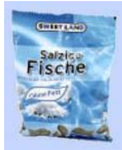
Sweetland Salzige Fische würziges Salzlakritz Hergestellt für Smile Factory GmbH, 46428 Emmerich