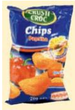
Crusti Croc Chips Paprika Snäcky Knabbergebäck GmbH, 31307 Uetze