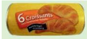
Croissants, backfertiger Frischteig Info Fita GmbH, 22056 Hamburg