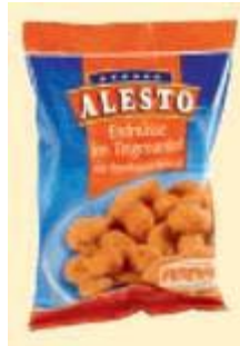
Alesto Erdnüsse im Teigmantel Kunz GmbH, 59939 Olsberg