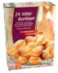
Mini-Berliner mit fruchtiger Himbeerfüllung Backfrost Caldino GmbH, 49497 Mettingen