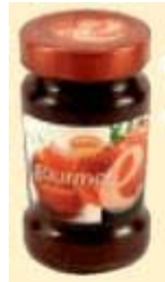
Göbber Gourmet Fruchtaufstrich Göbber GmbH & Co. KG, 27324 Eystrup

Info Göbber gehört zu den drei größten deutschen Konfitüreherstellern. Anstelle in kostspielige TV- oder Printwerbung zu investieren, pflegt das Eystruper Familienunternehmen lieber einen guten Draht zu den Discounter. Rund ein Drittel seines Absatzes im Lebensmittelhandel macht Göbber mit dem eigenen Label, der Rest geht auf das Konto »No-Name-Produktion«.