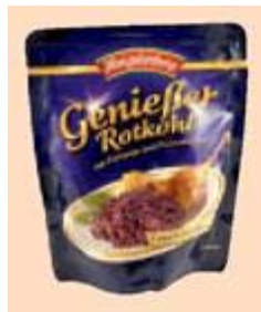
Hengstenberg Genießer-Rotkohl mit Portwein und Preiselbeeren Rich. Hengstenberg, 73726 Esslingen

Info Die Firma Voss & Zobus ist ein Tochterunternehmen von Hengstenberg, das auf Private Labels spezialisiert ist. Handelspartner könnten die »vielfältigen Kompetenzen« nutzen und beispielsweise bei der Produktentwicklung und Qualitätssicherung vom Mutterhaus Hengstenberg profitieren, heißt es im Firmenprofil. Plus macht davon offensichtlich gerne Gebrauch.