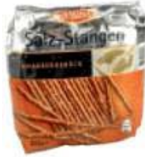
Sun Snacks Salzstangen Paulchen, 35096 Weimar