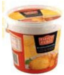
Harvest Basket Reibekuchenteig Landmanns GmbH, 91183 Abenberg