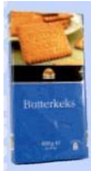
Choco Bistro Butterkeks Biscotto GmbH, 30006 Hannover