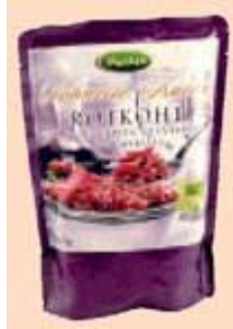
Giggles Rotkohl mit gezuckerten Cranberries und Marsala Exclusively For Plus by Voss & Zobus GmbH, 73728 Esslingen