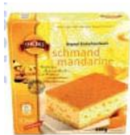
Thoks Schmandkuchen Mandarine Thoks GmbH, 99880 Waltershausen

Info Die thüringische Firma Thoks produziert tiefgekühlte Hefekuchen und hat sich seit ihrer Gründung im Jahr 1998 einen festen Platz in den Truhen der Supermärkte erobert. Um die Produktionskapazitäten auszulasten, werden unter dem Pseudonym »S&P« auch Discounter-Backwaren produziert.