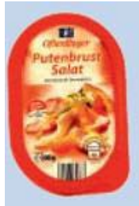
Ofterdinger Putenbrust-Salat Türk & Pabst GmbH, 46240 Bottrop