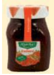
Maribel Erdbeerkonfitüre Extra Göbber GmbH & Co. KG, 27324 Eystrup