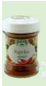
Fuchs Paprika edelsüß Fuchs edle Gewürze, 49198 Dissen

Info Die Unternehmensgruppe Fuchs GmbH ist weltweit der zweitgrößte Gewürzanbieter und schickt unter anderem seine Tochtergesellschaft Flora Gewürze ins Rennen, wenn es um Discount-Ware geht. Die Preisdifferenz beider Produkte ist beachtlich: Das Paprikapulver von Fuchs (45 Gramm) kostete 3,59 Euro, für 50 Gramm vom Norma-Gewürz mussten wir nur 49 Cent hinblättern.