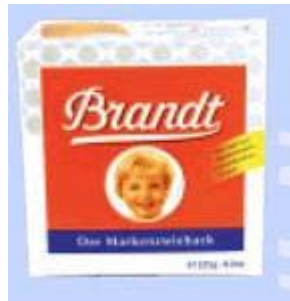
Brandt Der Markenzwieback Brandt Zwieback, 58103 Hagen

Info Die good food GmbH ist ein Tochterunternehmen der Brandt Gruppe, die neben Zwieback auch Knäckebrot, Schokolade und Knabberartikel herstellt. Produziert wird allerdings nicht mehr am Traditionsstandort Hagen, sondern im bayerischen Landshut und in Ohrdruf in Thüringen. Nach eigenen Angaben macht Brandt mit Zwieback einen Jahresumsatz von 60 Mio. Euro; wie hoch der Anteil an No-Name-Ware ist, behält das Unternehmen für sich.