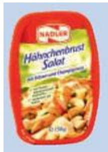
Nadler Hähnchenbrust-Salat Nadler Feinkost GmbH, 46240 Bottrop

Info »Um es einmal so zu formulieren: Private Labels haben für uns eine nicht unbedeutende Rolle. Das ergibt sich schon aus einem Handelsmarkenanteil im Markt von mehr als 50 Prozent. Türk & Pabst ist daher für uns eine unverzichtbare Preiseinstiegsmarke.« So klar bekennt sich der Feinkosthersteller Nadler in einem Interview mit der Lebensmittel Praxis zu seiner No-Name-Ausrichtung.