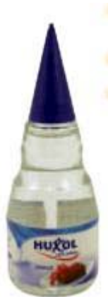
Huxol Flüssigsüßstoff Nutrisun GmbH & Co. KG, 21218 Seevetal

Info Die Firmen Medin und Nutrisun haben eine gemeinsame Dachgesellschaft: Die Laurens Spethmann Holding in Seevetal, deren eigentliches Metier der Tee-Handel ist (Meßmer, Milford). Praktischerweise liefert das Unternehmen gleich den passenden Süßstoff mit, einmal als günstige No-Name-Variante, einmal als etabliertes Markenprodukt.