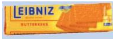
Leibniz Butterkeks Bahlsen, 30001 Hannover

Info Die Biscotto GmbH sitzt in Hannover ... und eigentlich erübrigt sich bei der Erwähnung dieses Ortes jede weitere Erklärung. Hannover ist Bahlsen und natürlich werden hier auch die Aldi-Kekse produziert. Wenn Sie Wert auf die »52 Zähne« eines echten Leibnitz-Kekses legen, müssen Sie natürlich zum Original greifen. Doch ansonsten ist sicher auch die Choco-Bistro-Alternative von guter Qualität.