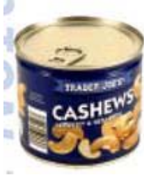
Trader Joe's Cashews Fa. Griff GmbH, 59939 Olsberg