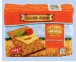
Trader Joe's Vollkornknäcke good food GmbH, 84003 Landshut