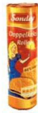
Sondey Doppelkeksrolle Flämische Keksfabrik, 47906 Kerpen