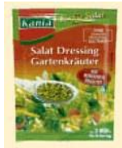
Kania Salat Dressing Weiland GmbH 49201 Dissen