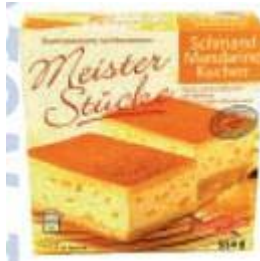
Meisterstücke Schmand-Mandarin-Kuchen S&P GmbH & Co. KG, 99880 Waltershausen