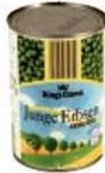
Junge Erbsen extra fein BFP GmbH, 72766 Reutlingen