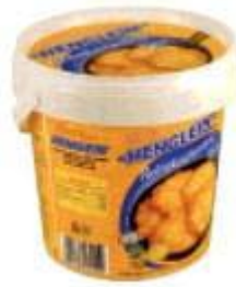
Henglein Reibekuchenteig Hans Henglein GmbH, 91183 Abenberg

Info Die Unternehmensgruppe Hans Henglein & Sohn GmbH produziert eine breite Palette an Klößen, Knödeln, Fertigteigen und weiteren Convenience-Produkten und betreibt einen ausgeklügelten Mix aus eigenen Marken und Handelsmarken. Als Private-Label-Hersteller springt die Tochterfirma Landmanns ein, die sich mit Henglein eine Adresse teilt.