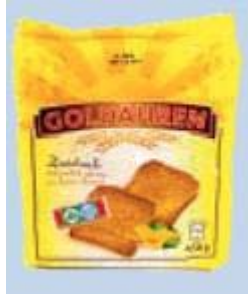
Goldähren Zwieback good food GmbH, 84003 Landshut