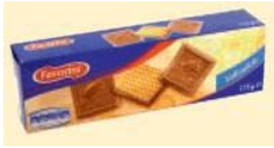
Favorini Gefüllte Waffel auf Vollmilch-Schokolade mit Nugatcreme Inter Biscuits GmbH, 29634 Schneverdingen