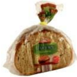
Wefa Bauernschnitten Wefa Brot GmbH, 52146 Würselen