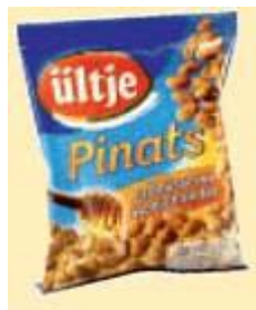
Ültje Pinats Erdnüsse im Honigmantel Ültje GmbH, 58207 Schwerte

Info Sobald Markenhersteller neuartige Produkte - wie in diesem Beispiel teigumhüllte Erdnüsse - erfolgreich eingeführt haben, schießen die Discounter hinterher und ordern entsprechende »Me too«-Alternativen. Bei Lidl stammt die Eigenmarke offiziell von einer Kunz GmbH, die interessanterweise ebenso wie Ültje zum Mutterhaus »The Nut Company« gehört.