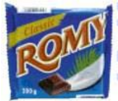
Romy Gefüllte Milkschokolade mit Kokoscreme Hosta Schokolade GmbH & Co., 74597 Stimpfach

Info Die Kokoschokolade Romy ist ein Klassiker im Süßigkeitenregal und wird vom Familienunternehmen Hosta produziert. Doch ausschließlich auf die eigene Marke verlässt man sich im baden-württembergischen Stimpfach nicht, Private Labels sind bei Hosta ein zweites, wichtiges Standbein. Große Unterschiede dürften in der Produktion wohl nicht gemacht werden: Die Zutatenlisten von Romy und Mauritius stimmen haarklein überein.