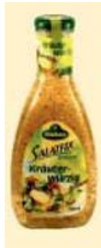
Kühne Salatfix Kräuterwürzig Carl Kühne, 22761 Hamburg

Info Sie bringen Ihren Salat gerne mit Kühne Salatfix auf den Tisch? Dann können Sie es ruhig mal auf einen Vergleich mit der günstigeren Lidl-Variante ankommen lassen. Nachdem die Zutatenliste und die Nährwertkennzeichnung identisch sind, dürfte es eigentlich auch beim Geschmack keine allzu großen Unterschiede geben.