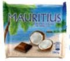
Mauritius Gefüllte Milkschokolade mit Kokoscreme Hosta GmbH & Co., 74597 Stimpfach