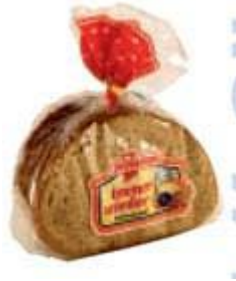
Kronenbrot Weizenmischbrot Kronenbrot KG, 52146 Würselen

Info Brot, ein absoluter Frischeartikel, stammt je nach Region von unterschiedlichen Betrieben.