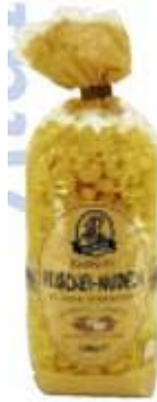
Landvogt Frischei-Nudeln mit reinem Hartweizengrieß T.A.G. Nahrungsmittel GmbH, 71304 Waiblingen