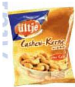
Ültje Cashew-Kerne Ültje GmbH, 58207 Schwerte

Info Die Ültje GmbH ist ein Unternehmen von »The Nut Company«, Europas größtem Nussverarbeiter, der auch die Marken Felix und Pittjes produziert. Neben dem Stammhaus in Schwerte werden die pikanten Knabbereien auch im sauerländischen Olsberg hergestellt. »Überraschenderweise« teilen sich in diesem Ort der Marktführer TNC und der Aldi-Lieferant Griff die gleiche Adresse: Beide logieren in der Industriestraße 3.