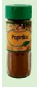
Columbia Paprika edelsüß Flora Gewürze, 49198 Dissen