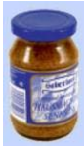
Haberland Hausmacher Senf Süß Haberland Marketing GmbH, 93197 Zeitlarn