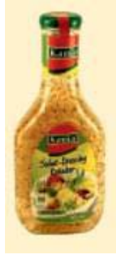
Kania Salat-Dressing Kräuter Gritto Werke, 19221 Hagenow