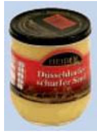
Heiden Düsseldorfer scharfer Senf v. d. Heiden GmbH, 40004 Düsseldorf